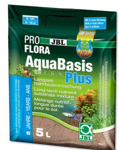
JBL PROFLORA AquaBasis plus Sustrato nutritivo duradero p. acuarios de agua dulce