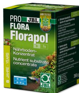
JBL PROFLORA Florapol Fertiliz. sustrato efecto prolong. acuarios agua dulce