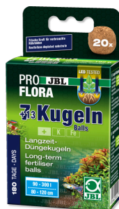
JBL PROFLORA 7 + 13 bolas Estimulador de raíces para acuarios de agua dulce