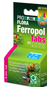
JBL PROFLORA Ferropol Tabs

Fertiliz. diario para plantas de acuario de agua dulce