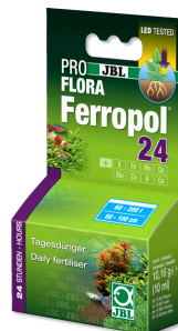
JBL PROFLORA Ferropol 24

Fertilizante para plantas para acuarios de agua dulce