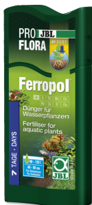
JBL PROFLORA Ferropol

Fertilizante para plantas para acuarios de agua dulce