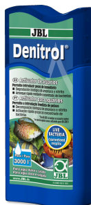
JBL Denitrol Activador biológico para introducir peces de acuario