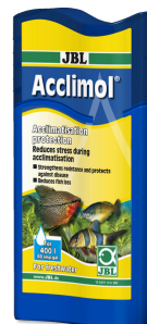
JBL Acclimol Acondicionador para la aclimatación de peces nuevos