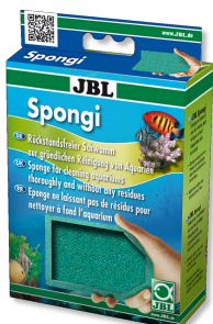
JBL Spongi Esponja de limpieza para acuarios y terrarios