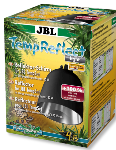
JBL TempReflect light Pantalla reflectora para lámparas de bajo consumo