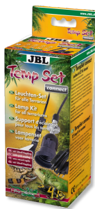
JBL TempSet connect Kit de instalación con conexión de enchufe