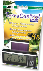
JBL TerraControl Solar Termómetro solar e higrómetro para todos los terrarios