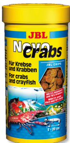
JBL NovoCrabs Alimento básico en pastillas para crustáceos