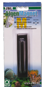
JBL Algae magnet Imán limpiacristales para cristales de acuario