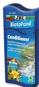
JBL BiotoPond Acondicionador para el agua del estanque