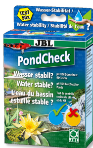
JBL PondCheck Test rápido para determinar el valor del pH y de la KH