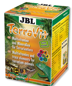
JBL TerraVit polvo Vitaminas y micronutrientes para animales de terrario