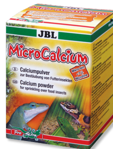
JBL MicroCalcium Pienso complementario rico en minerales para reptiles