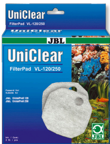
JBL FilterPad VL

Filtro de algodón para filtros CristalProfi