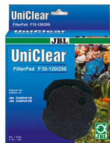
JBL FilterPad F35 Espuma de poro fino para el filtro CristalProfi