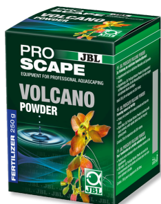
JBL PROSCAPE VOLCANO POWDER Aditivo de largo efecto para acuarios con plantas