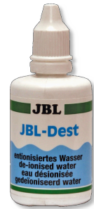
JBL Dest Gedestilleerd water voor reiniging van pH-elektroden