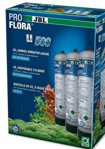
JBL PROFLORA 3 x u500 CO2-wegwerp voorraadfles