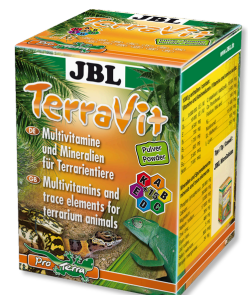
JBL TerraVit poeder Vitamines en sporenelementen voor terrariumdieren