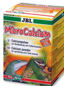
JBL MicroCalcium Aanvullend voer met mineralen voor alle reptielen