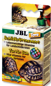
JBL Schildpadzon Terra Vitamines voor landschildpadden