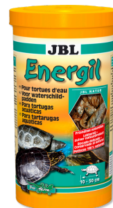
JBL Energil Hoofdvoer voor moeras- en waterschildpadden