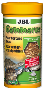
JBL Gammarus Lekkernij voor waterschildpadden van 10-50 cm