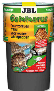
JBL Gammarus Navulverpakking Lekkernij voor waterschildpadden van 10-50 cm