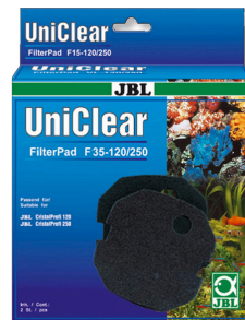
JBL FilterPad F35 Fijn schuimstof voor CristalProfi aquariumfilters