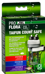
JBL PROFLORA CO2 TAIFUN COUNT SAFE Compte-bulles de CO2 avec clapet antiretour intégré