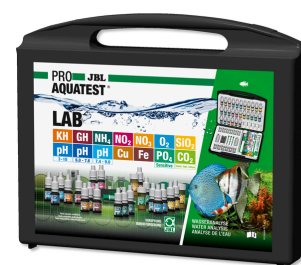
JBL PROAQUATEST LAB Coffret de 13 tests pour analyse de l'eau douce