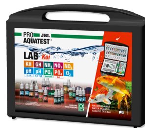
JBL PROAQUATEST LAB Koi Coffret de tests professionnel pour bassins