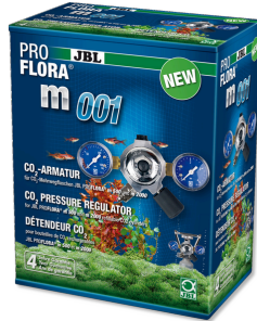
JBL PROFLORA m001 Détendeur pour réduction de pression