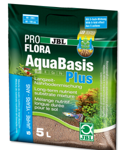
JBL PROFLORA AquaBasis plus

Engrais longue durée pour aquariums d'eau douce