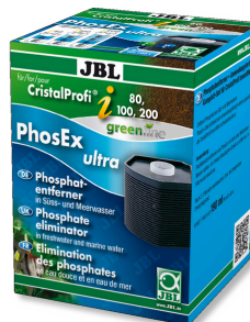
JBL PhosEx Ultra CristalProfi i60/80/100/200 Cartouche de produit antiphosphate pour CristalProfi i