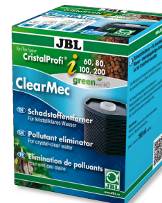
JBL ClearMec CristalProfi i60/80/100/200 Éliminateur de nitrites, nitrates, phosphates pour CPI