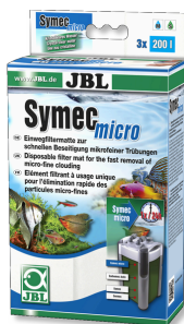
JBL Symec micro Microfibre pour filtre d'aquarium contre l'eau turbide