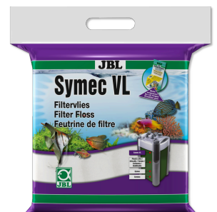
JBL Symec VL Microfibre filtrante contre toutes turbidités de l'eau