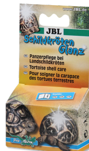
JBL Brilliant pour tortues Produit d'entretien des carapaces de tortues