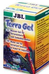
JBL TerraGel Gel aqueux pour animaux de terrarium