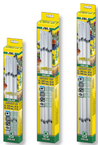
JBL SOLAR Reflect T5/ T8 (895-1500 mm) Réflecteur pour tube fluorescent SOLAR