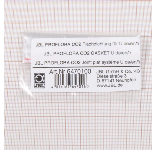
Junta plana para U, JBL PF CO2