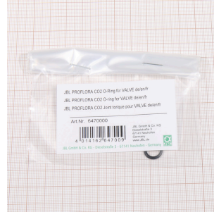
Junta tórica para VALVE, JBL PF CO2