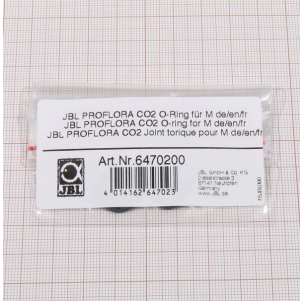
JBL PROFLORA CO2 Junta tórica para M