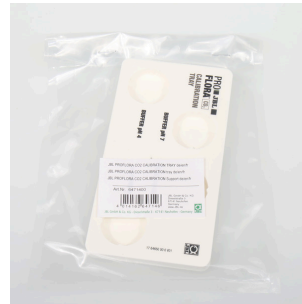
JBL PF CO2 CALIBRATION Tray Apoyo seguro de las cubetas durante la calibración