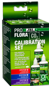
JBL PROFLORA CO2 CALIBRATION SET Para calibrar y conservar los electrodos de pH