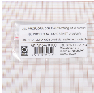
Junta plana para U, JBL PF CO2