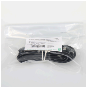
Sensor de temperatura JBL PF CO2 CONTROL