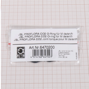
JBL PROFLORA CO2 Junta tórica para M