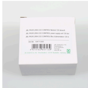
Fuente de alimentación 12V JBL PF CO2 CONTROL