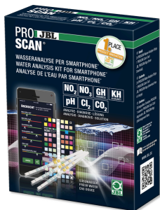
JBL PROSCAN Test para el agua con evaluación por smartphone