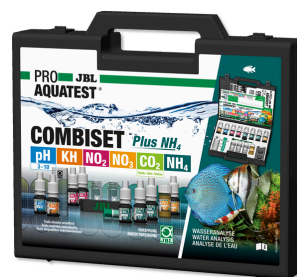
JBL PROAQUATEST COMBISET Plus NH4 Maletín con los test más importantes + test de NH4