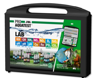
JBL PROAQUATEST LAB Maletín con 13 test para analizar el agua dulce