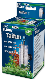
JBL PROFLORA Taifun S Difusor de CO2 ampliable para acuarios pequeños