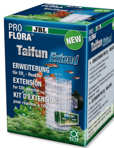
JBL PROFLORA Taifun Extend Ampliación para el reactor de alta difusión de CO2