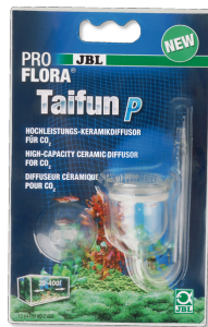
JBL PROFLORA Taifun P Minidifusor de CO2 para nano acuarios de agua dulce