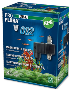
JBL PROFLORA v002 Válvula electromagnética silenciosa