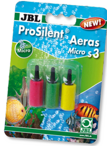
JBL ProSilent Aeras Micro S3 Piedras difusoras p. burbujas de aire finas en acuario