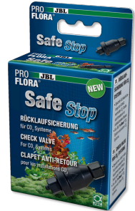
JBL PROFLORA SafeStop Válvula de retención de agua para sistemas de CO2