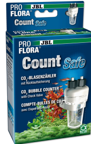
JBL PROFLORA CO2 Count Safe Contador de burbujas con válvula de retención