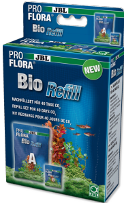
JBL PROFLORA BioRefill Set relleno para sist. biológicos fertilizantes de CO2