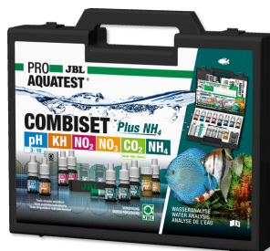
JBL PROAQUATEST COMBISET Plus NH 4 Maletín con los test más importantes + test de NH 4