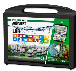
JBL PROAQUATEST LAB Maletín con 13 test para analizar el agua dulce