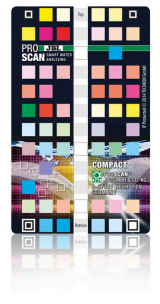
JBL PROSCAN ColorCard