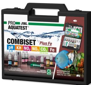
JBL PROAQUATEST COMBISET Plus Fe Maletín con los test más importantes + test de hierro