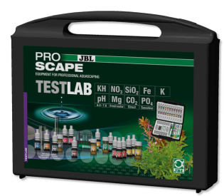
JBL PROAQUATEST LAB PROSCAPE Maletín de tests para analizar agua acuarios plantados