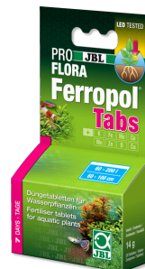
JBL PROFLORA Ferropol Tabs

Fertiliz. diario para plantas de acuario de agua dulce