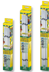
JBL SOLAR Reflect T5/T8 - 895-1500 mm Lámina reflectora para tubo fluorescente solar