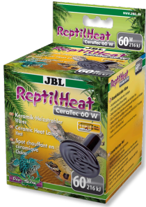
JBL ReptilHeat Lámpara calefactora de cerámica