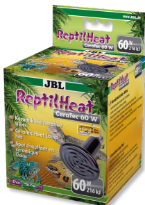
JBL ReptilHeat Lámpara calefactora de cerámica