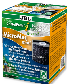
JBL MicroMec CristalProfi i60/80/100/200 Bolas filtrantes de alto rendimiento p. CristalProfi i