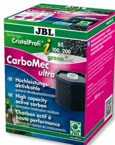
JBL CarboMec ultra CristalProfi i60/80/100/200 Bolsita con carbón activo para la gama CristalProfi i