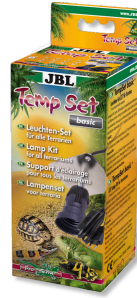
JBL TempSet basic Kit de instalación para lámparas de terrario