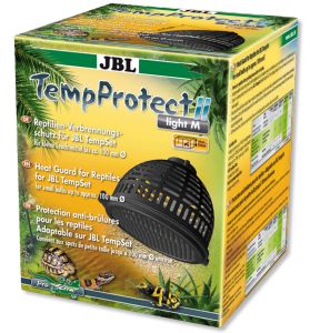
JBL TempProtect II light Protector contra quemaduras reptiles para JBL TempSet