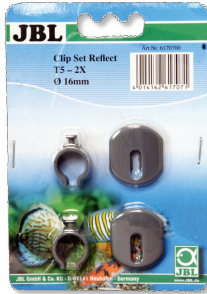
JBL SOLAR REFLECT Set clips Soporte para tubos fluorescentes