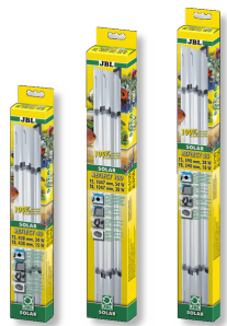
JBL SOLAR Reflect T5/ T8 - 895-1500 mm Lámina reflectora para tubo fluorescente solar