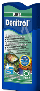
JBL Denitrol Activador biológico para introducir peces de acuario