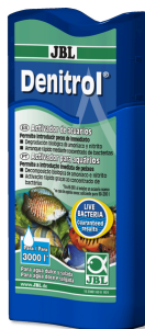
JBL Denitrol Activador biológico para introducir peces de acuario