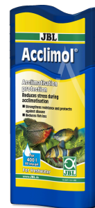
JBL Acclimol Acondicionador para la aclimatación de peces nuevos