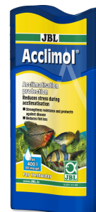
JBL Acclimol Acondicionador para la aclimatación de peces nuevos