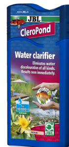
JBL CleroPond Clarificador para eliminar enturbiamientos del agua