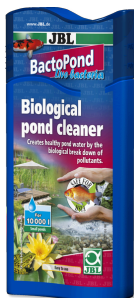
JBL BactoPond Bacterias para la autolimpieza del estanque