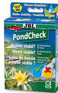
JBL PondCheck Test rápido para determinar el valor del pH y de la KH