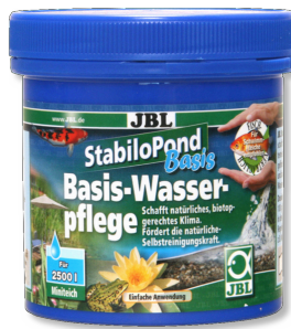
JBL StabliPond Basis Producto para el cuidado básico de todos los estanques