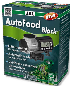
JBL AutoFood BLACK Comedero automático negro para peces de acuario