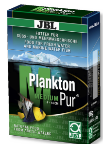
JBL Plankton Pur MEDIUM Golosinas para peces de acuario grandes