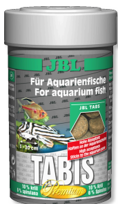
JBL Tabis Pastillas especiales para peces de agua dulce y salada