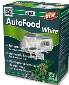
JBL AutoFood WHITE Comedero automático blanco para peces de acuario