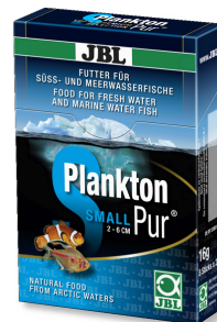
JBL Plankton Pur SMALL Golosinas para peces de acuario pequeños