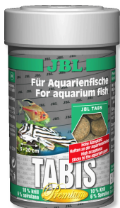
JBL Tabis Pastillas especiales para peces de agua dulce y salada