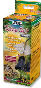
JBL TempSet angle Kit de instalación para lámparas de terrario