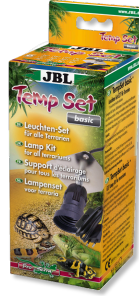
JBL TempSet basic Kit de instalación para lámparas de terrario