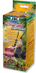
JBL TempSet angle+ connect Kit de instalación para lámparas de terrario