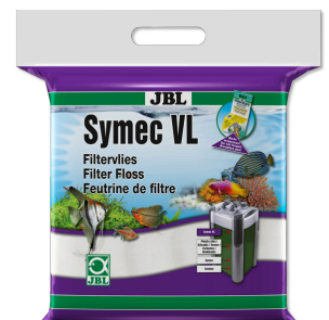
JBL Symec VL Filtro de algodón para eliminar todo enturbiamiento