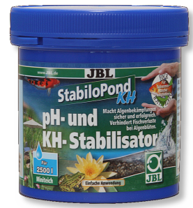
JBL StabiloPond KH Estabilizador del pH para estanques de jardín