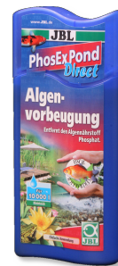
JBL PhosEx Pond Direct Eliminador de fosfatos para el estanque