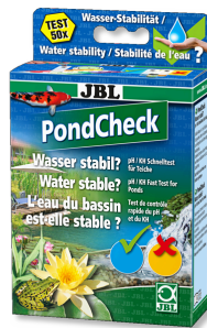
JBL PondCheck Test rápido para determinar el valor del pH y de la KH