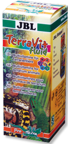
JBL TerraVit fluid Vitaminas y micronutrientes para animales de terrario