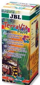
JBL TerraVit fluid Vitaminas y micronutrientes para animales de terrario