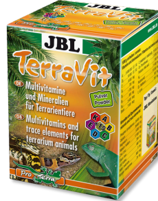
JBL TerraVit polvo Vitaminas y micronutrientes para animales de terrario