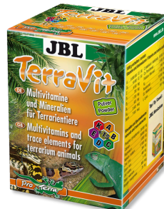
JBL TerraVit polvo Vitaminas y micronutrientes para animales de terrario