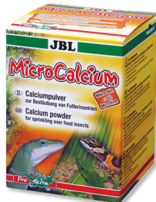
JBL MicroCalcium Pienso complementario rico en minerales para reptiles