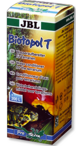
JBL Biotopol T Acondicionador del agua para terrarios