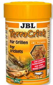
JBL TerraCrick Alimento completo para insectos vivos