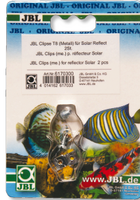
JBL Clips T5/T8 metal Soporte de metal para tubos fluorescentes